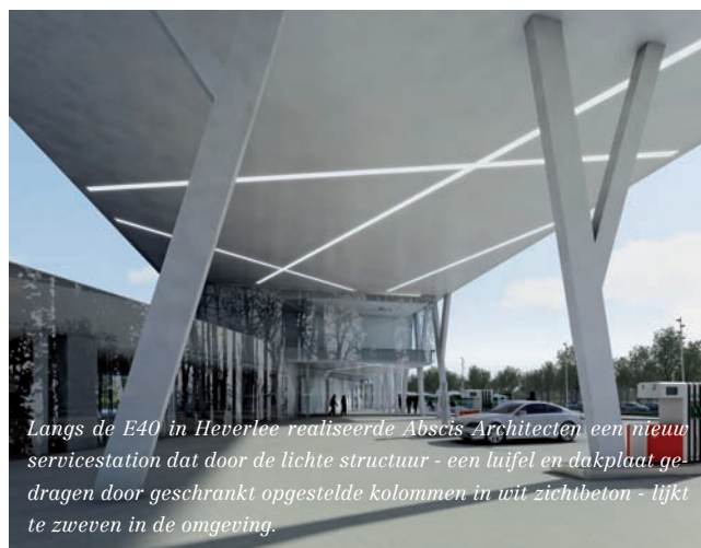
Langs de E40 in Heverlee realiseerde Abscis Architecten een nieuw servicestation dat door de lichte structuur - een luifel en dakplaat gedragen door geschrinkt opgestelde kolommen in wit zichtbeton - lijkt te zweven in de omgeving.

Lieven Louwyck: “Voor wedstrijden in PPS-constructies wordt van de inschrijvers – meestal de ontwikkelaar-aannemers dus - een tot in de kleinste details uitgewerkt dossier verwacht. Daar moet een redelijke vergoeding tegenover staan, zodat die inschrijvers niet in de rode cijfers belanden. Alleen moeten we jammer genoeg constateren dat men in het buitenland veel meer veil heeft voor goede ideeën dan hier.”