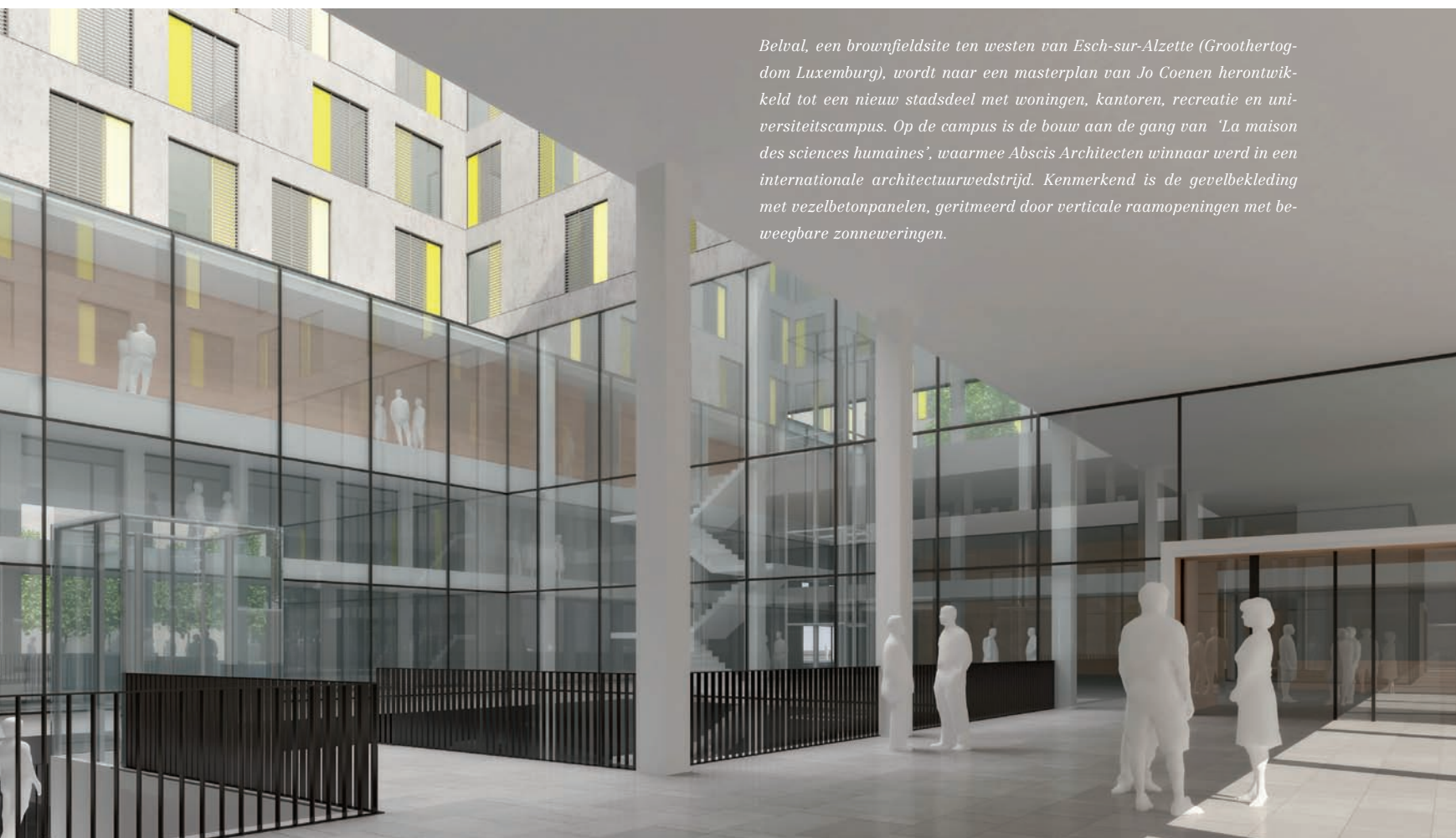
Belval, een brownfieldsite ten westen van Esch-sur-Alzette (Groothertogdom Luxemburg), wordt naar een masterplan van Jo Coenen herontwikkeld tot een nieuw stadsdeel met woningen, kantoren, recreatie en universiteitscampus. Op de campus is de bouw aan de gang van 'La maison des sciences humaines', waarmee Abscis Architecten winnaar werd in een internationale architectuurwedstrijd. Kenmerkend is de gevelbekleding met vezelbetonpanelen, geritmeerd door verticale raamopeningen met beweegbare zonneweringen.