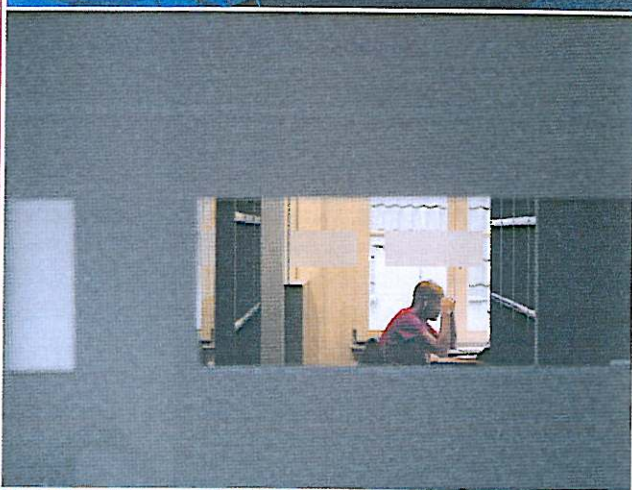
Er is een groot aantal individuele en collectieve werkplekken ingericht.