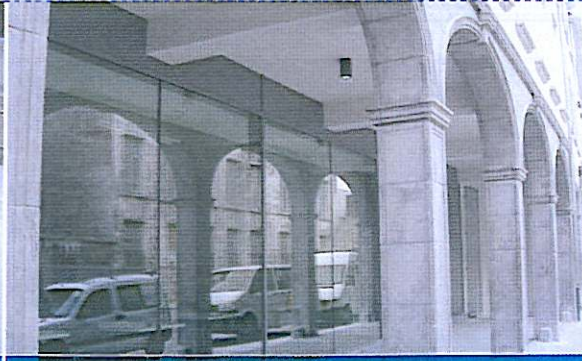
De arcade langs de Veruissstraat werd opgenomen in het openbaar domein.