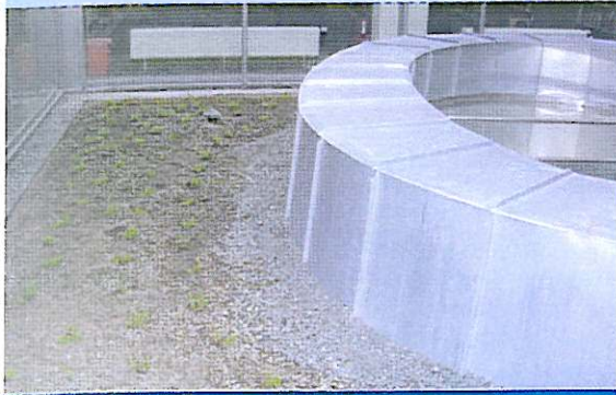
De grote platte daken zijn als groendak uitgevoerd.