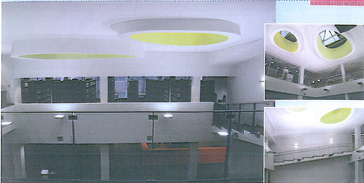
Eivormige lichtkoepels zorgen voor indirecte lichtinval.

Geen enkel boek was langer dan één dag onbeschikbaar. De digitale catalogus (ANET) omvat eveneens de verzamelingen van onder meer de Antwerpse stadsbibliotheek, de Universiteit Hasselt, het Antwerps Havenbedrijf, het Stadsarchief en diverse hogescholen, musea en andere instellingen. Veel van deze bibliotheken bevinden zich eveneens in het Antwerpse stadscentrum. Het gebundelde aanbod van ANET kan de vergelijking met de universiteitsbibliotheken van Leuven en Gent gemakkelijk doorstaan.