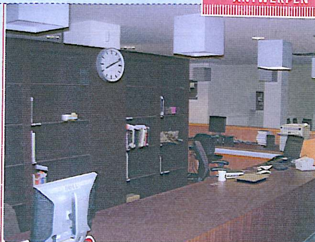
De balie kreeg een herkenbare, tulle kleur.

"We proberen zoveel mogelijk boeken in open rekken te plaatsen, zodat onze lezers meteen zelf hun materiaal kunnen vinden," legt hoofdbibliothecaris Trudi Noordermeer uit. "Vandaar ook de keuze voor publiekstoegankelijke compactrekken op een aantal plaatsen. Bovendien zijn steeds meer wetenschappelijke tijdschriften en documenten ook of zelfs alleen elektronisch beschikbaar. Dat geldt nu vooral voor de exacte en toegepaste wetenschappen, maar deze trend is ook niet afwezig in de humane wetenschappen. De bibliotheek is geabonneerd op meer dan 10.000 elektronische tijdschriften." Die evolutie speelde mee in de keuze om een groot aantal lees- en studieplekken in te richten, samen ongeveer 785. "We beschikken over een draadloos netwerk, maar de studenten en de universiteitsmedewerkers kunnen ook thuis inloggen." Al jaren voor de eenmaking van de universiteit een feit was hadden de bestaande universitaire centra hun bibliotheekcatalogi op dezelfde leest geschoeid en digitaal gebundeld. Dat was praktisch om de verspreide boeken hun nieuwe plaats toe te wijzen en om er mee voor te zorgen dat die grootscheepse verhuisoperatie op ultrakorte termijn kon worden afgerond, tijdens de zomervakantie. ➔